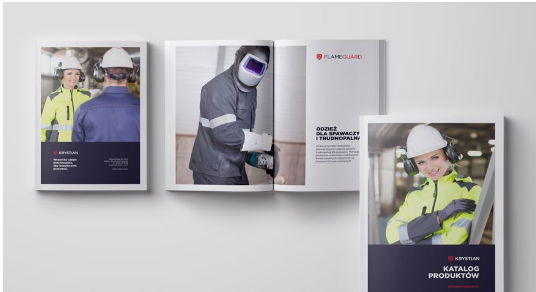
Przykłady wykorzystania marki - katalog produktów