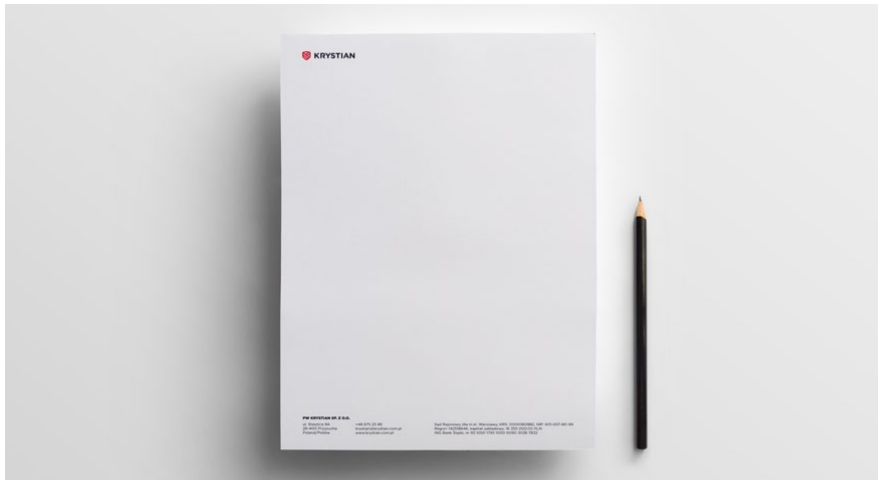
Przykłady wykorzystania marki - papier firmowy