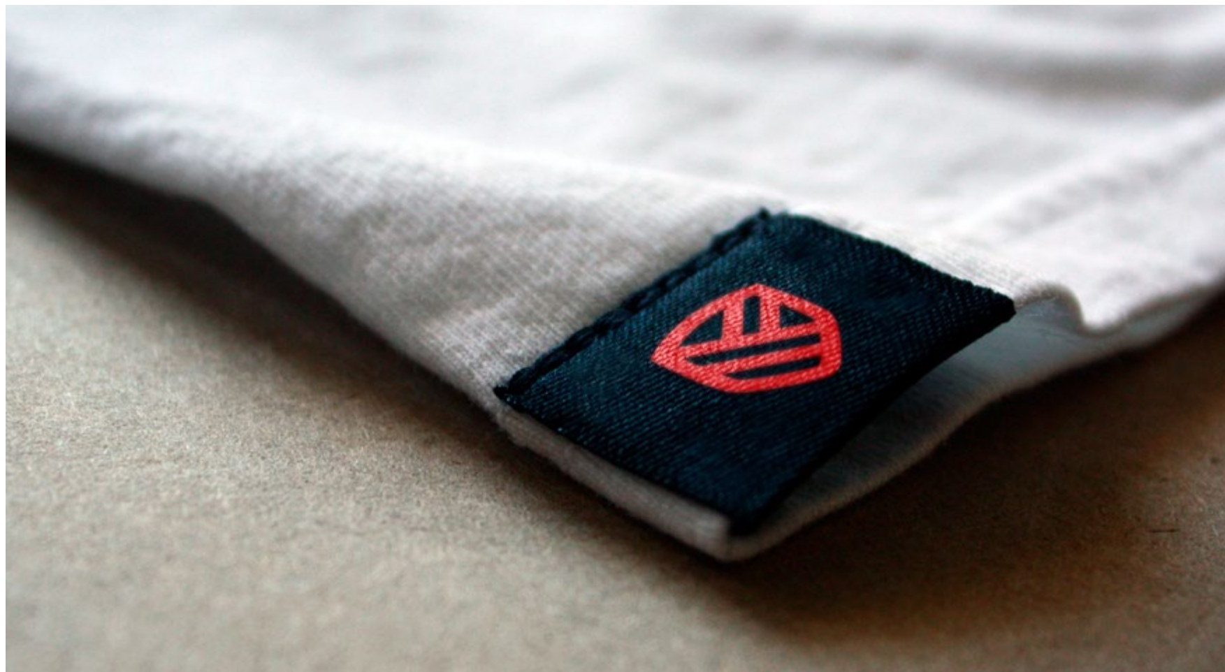
Przykłady wykorzystania marki - wyszycie sygnetu