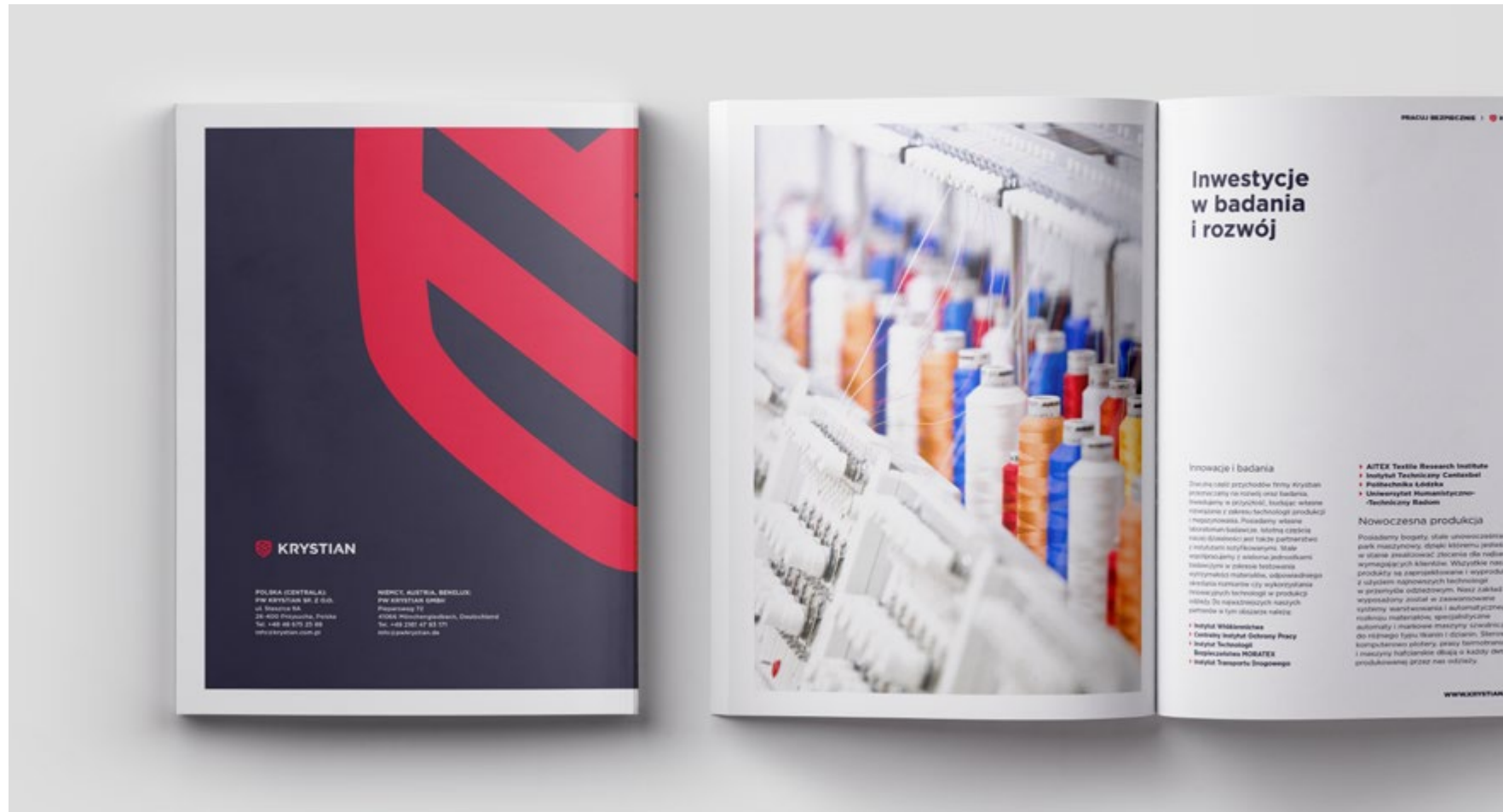
Przykłady wykorzystania marki - layout broszury