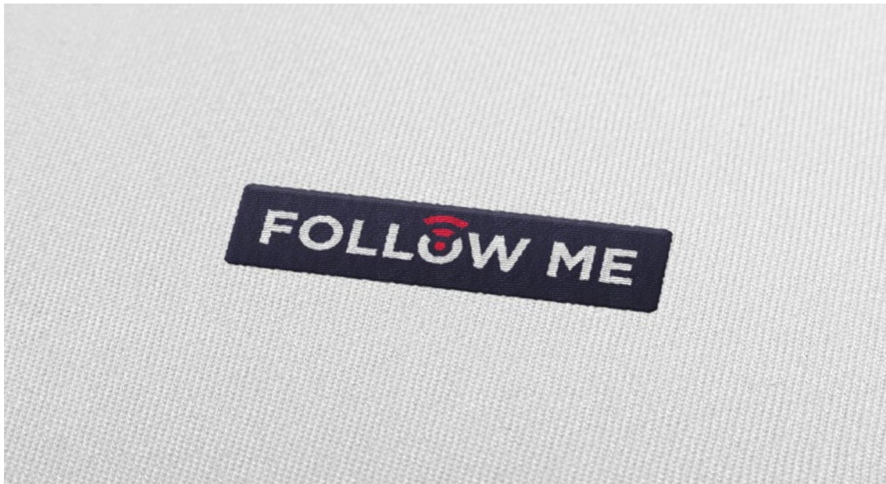
Przykłady wykorzystania marki - wyszycie logotypu systemu Follow Me