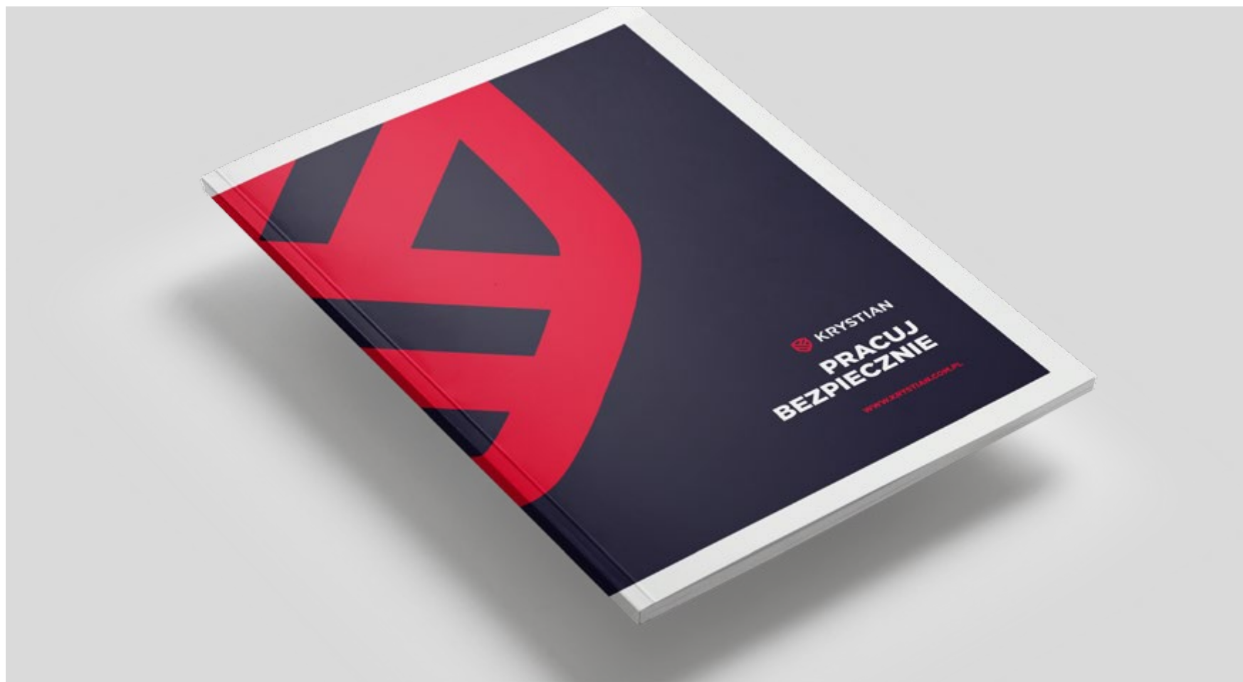
Przykłady wykorzystania marki - okładka broszury